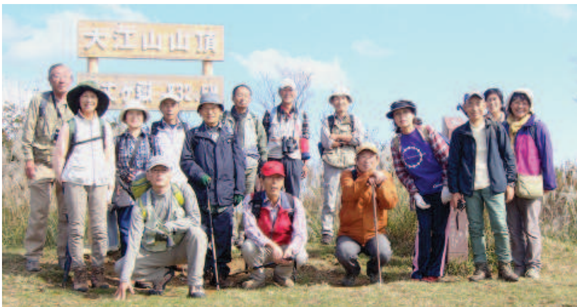
写真-3: 本日の参加者 15 名 / 千丈ヶ嶽山頂 (832.5M) にて

オウツシロギ ・別名: オスミ ヤマリンゴ ズミキ ・バラ科・リンゴ属 ・葉→互生 ・葉裏: 綿毛が密生 白く見える ・縁: 鈍鋸歯又はふ ぞろいな鋸歯 ↓ Q. クラジロと何が異なるの?