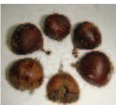
①ヒト：カケリ ( )