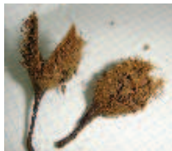
③ヒト：果実は断面が三角 ( )