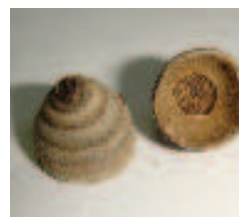
④ヒト：葉裏面粉白色 ( )