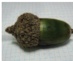
②ヒト：葉柄なし ( )