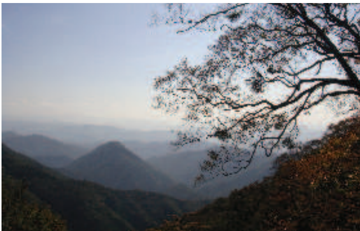
写真-2: 鬼嶽稲荷神社前の右手にヤドリギ