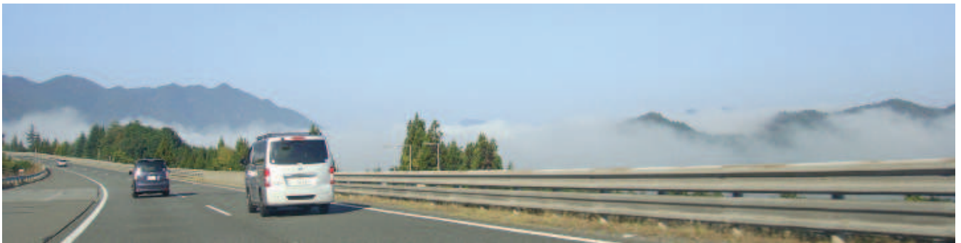
写真-1: 篠山トンネルをぬけると丹波霧が発生しており、福地山まで雲海の別世界でした。