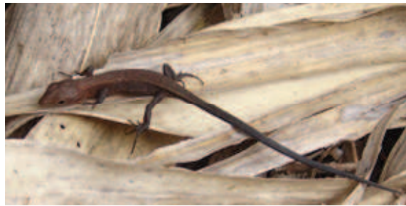
( ) 体長 6~7 ㎝