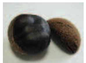
⑤ヒト：灰汁抜→食用可 ( )