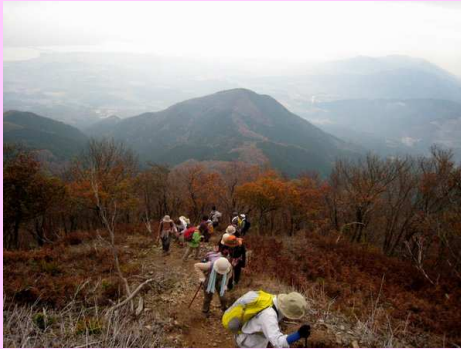
あと一歩で稜線へ