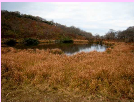
小女郎ヶ池で昼食