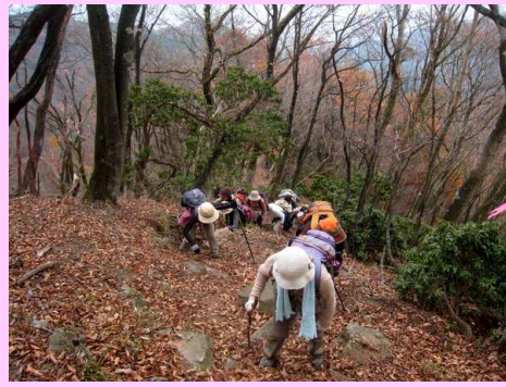
権現山直下の難所