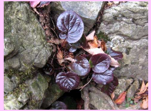
イワカガミの群落