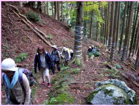
スギ・ヒノキ林を登る