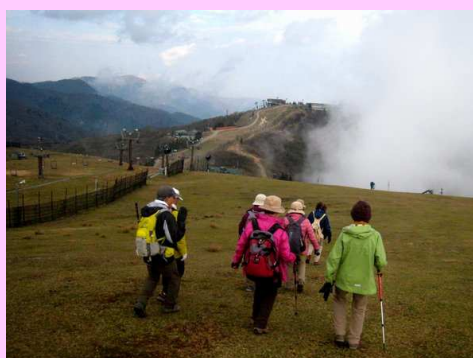
打見山へゲレンデを歩く