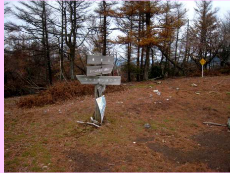
カラマツの権現山